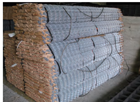
製品を豊富に取り揃えています